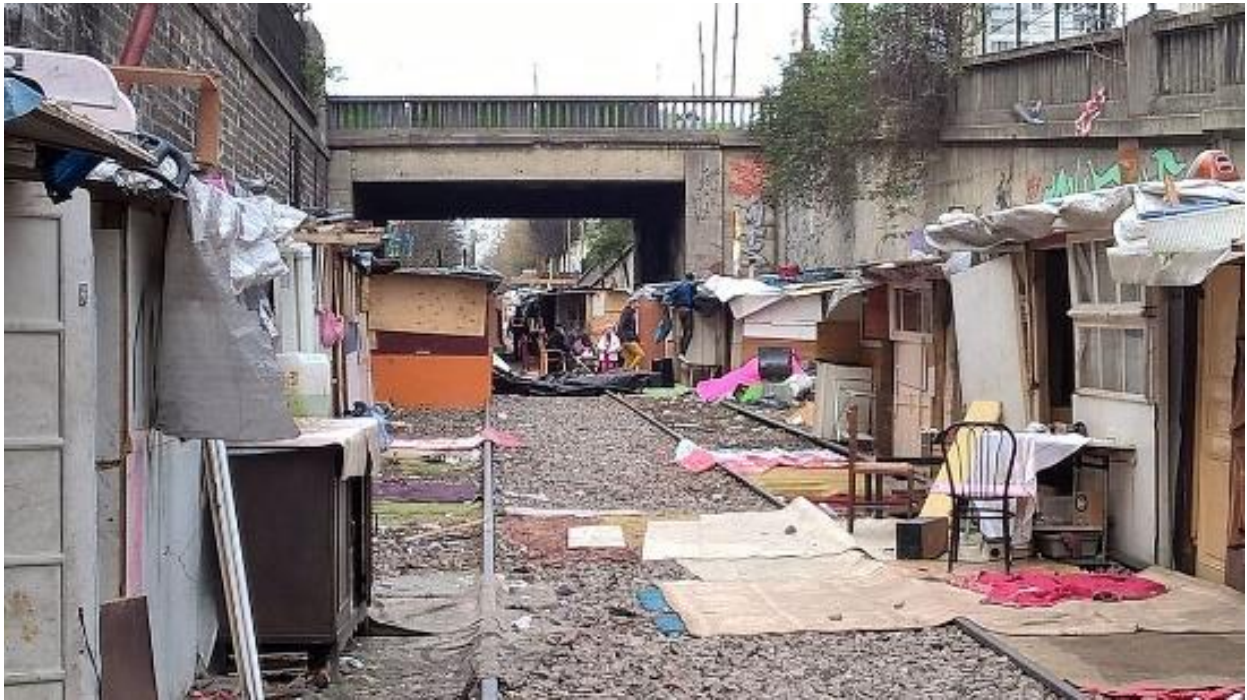
Bidonville à Paris 18e, mars 2017

Paris : la ville de l'amour, la capitale de la mode, l'endroit préféré des touristes. Pourtant, dans cette ville aussi, il y a des problèmes. Les bidonvilles des périphéries de la capitale française avaient été progressivement supprimés, mais depuis les années 1990, ils réapparaissent.